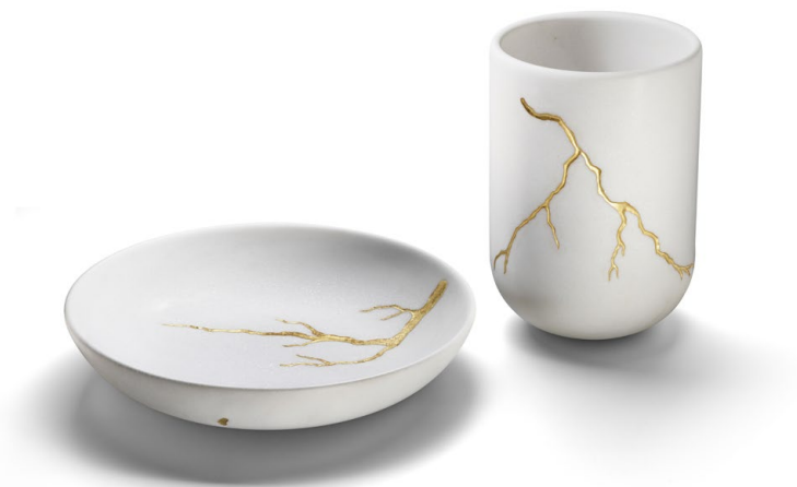
THUNDERSTORM Objet d'Art. Marbre Tassos sculpté et relevé à la feuille d'or.