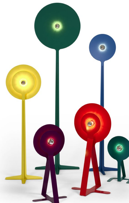
RANDOGNE Sculptures lumineuses. Acier thermolaqué et aluminium.