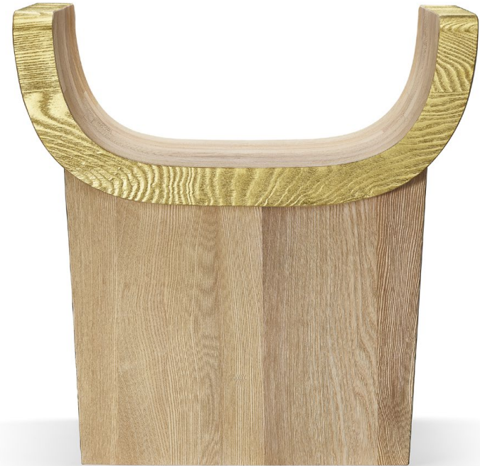
THE LOST THRONE OF MOUNT OLYMPUS GOLD Siège. Frêne sculpté et feuille d'or.

Il crée des pièces à vivre, à partager et à transmettre aux générations futures.